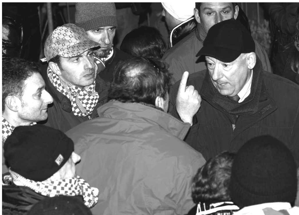
Scambi di opinioni prima dell'annullamento del Palio.

fondo di garantire il corretto svolgimento della corsa, vivendo lì dove si creavano i problemi alla "partenza" o alla Ceramica, benché il sottoscritto non rappresenti l'or-