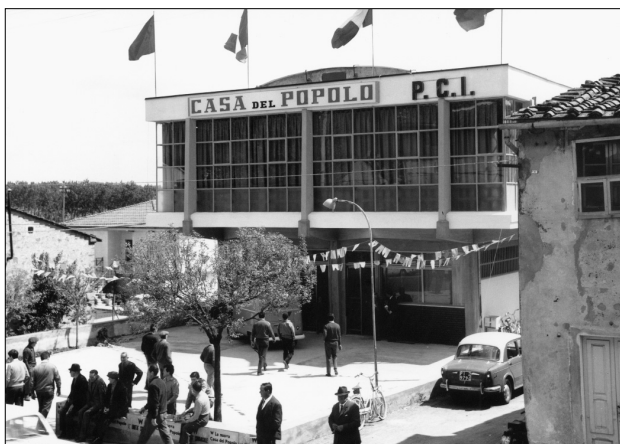
1° Maggio del 1968: inaugurazione della Casa del Popolo.