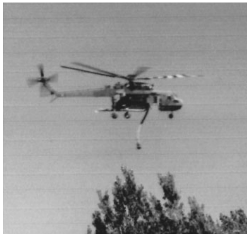
L'elicottero Erikson che porta fino a 9000 litri. Si pensi che quelli con il secchio tengono non più di 500 litri!

Uno degli elicotteri con il secchio, durante i mesi estivi, staziona proprio sul Monte Serra, nella base sopra Prato alla Taneta, mentre l'altro è a Tassignano. Poi ce n'è uno da ricognizione che è dislocato a San Rossore, mentre il più grande, a cui ti riferisci, è del servizio nazionale e può attingere acqua solo da specchi d'acqua più grandi.