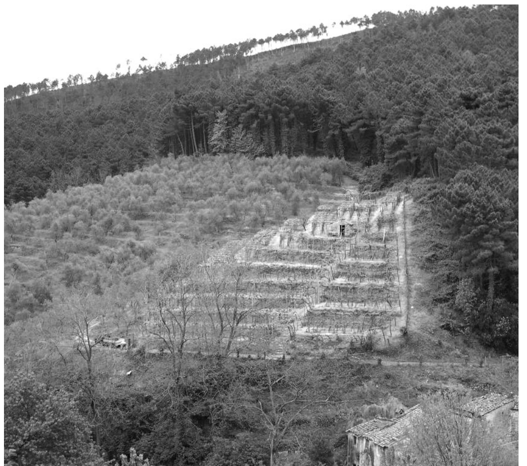
Uno scorcio caratteristico del paesaggio agrario dei nostri monti.