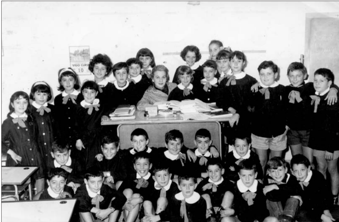
Anno scolastico 1964/65: classe IVa. elementare.